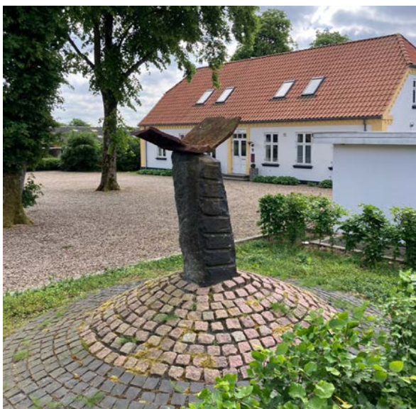
Kunstværket "Vinger 2000"

Vi bringer ofte denne meddelelse, da SKAT somme tider ændrer på fremgangsmåden.