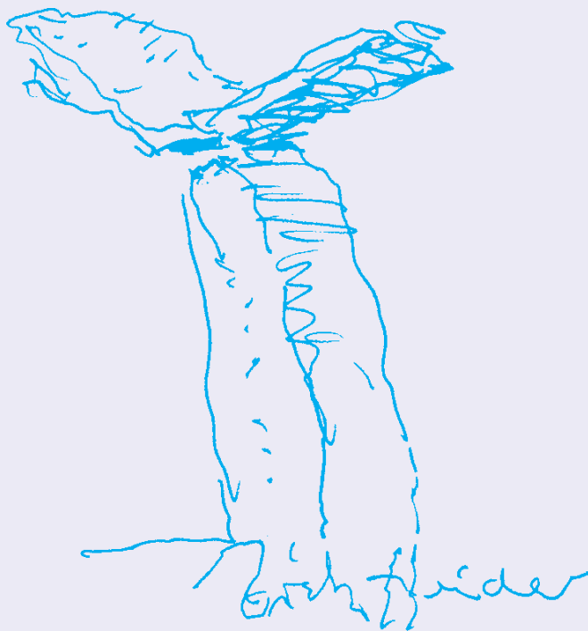
„Vinger“ Skulptur af Erik Heide

Aulum Højskoleforening Vinding-Vind Foredragsforening Aulum-Vinding-Vind Valgmenighed