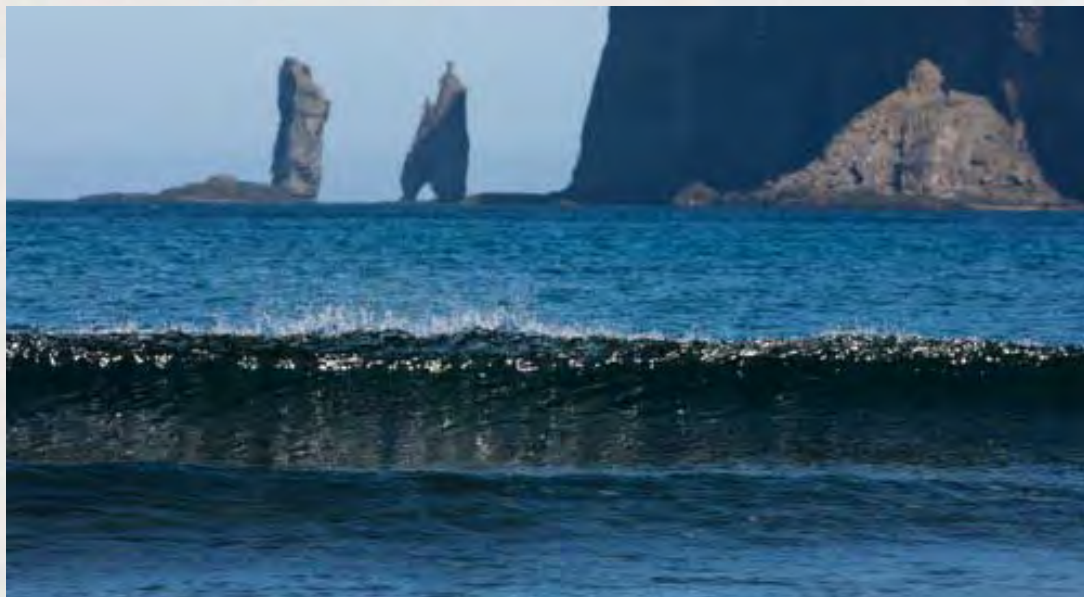
„Kæmpen og Kællingen“ i brænding ved Tjørnuvik.