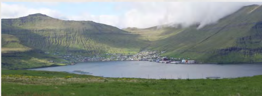
Fuglefjord på Østerø

For alle tilmeldte arrangeres der en fælles optaktsdag i foråret med yderlig oplysninger om rejsen og fortælling om Færøerne. Dato tid og sted oplyses senere